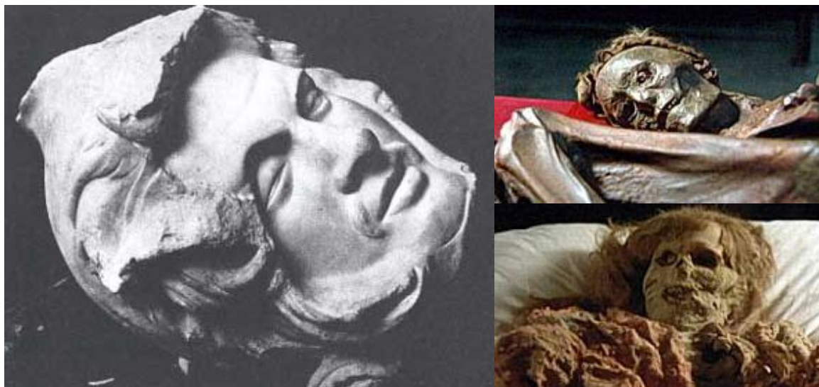
Obr. „Hlava mrtvého Peršana“ 230 – 220 p.n.l.

Slované, Keltové, Germáni, Románi a Baltové aj., ti všichni byli známi jako vynikající bojovníci. A pro všechny tyto kmeny byla společná vysoká kultura, vysoké znalosti hutnické, pastevecké, pěstivelské a mnoho a mnoho dalšího. Je bez diskusí, že to, co dokázaly indoevropské kmeny, bylo na jejich (a vlastně i na naši) dobu naprosto impozantní. Je třeba si opravdu uvědomit, že kamkoli přišli, platili za elitu. (Právě kmen Árijů založil v Indii kastový systém. Člen nižší kasty se prakticky nemohl stát členem kasty vyšší. Árijové tak – možná instinktivně – chránili svou rasovou jedinečnost a čistotu.)