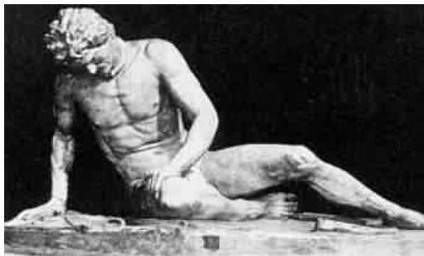
Obr. Vlevo „Germán“ v podání německého sochaře A.Brekerera