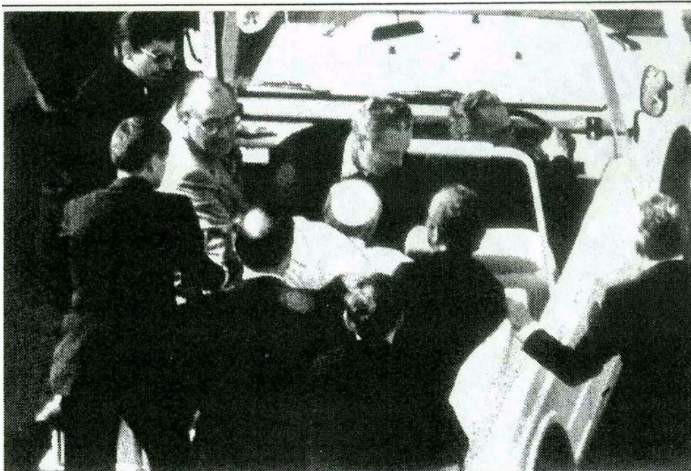
Jan Pavel II. se po výstřelech hroučí do rukou svých průvodců