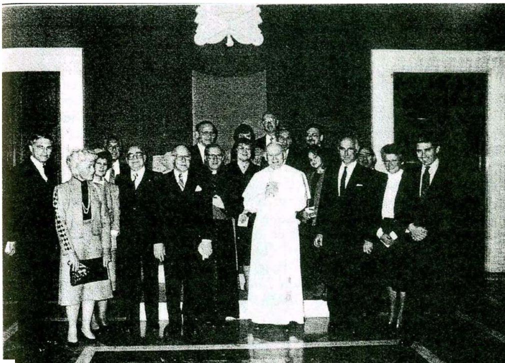
Skupinový snímek s bratrem „papežem“.

Dne 22. března 1984 přijal Wojtyła představitele židovské zednářské sekty B'nai B'rith. Přednesený projev mluví za celé svazky: „ Milí přátelé! Je mi velkým potěšením přivítat vás ve Vatikánu. ... Pro tuto příležitost je vhodný úvodní verš 133. žalmu: ‚Jaké dobro, jaké blaho tam, kde bratři bydlí svorně!‘ ... Je to setkání mezi ‚bratry‘, dialog mezi první a druhou částí Bible ... “